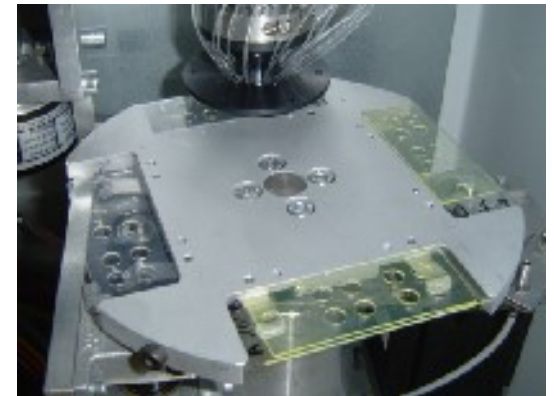
Détection de menaces terroristes (charbon, anthrax...)