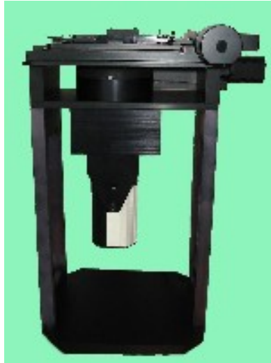
Lecteur de plaques 96 puits (drug discovery)