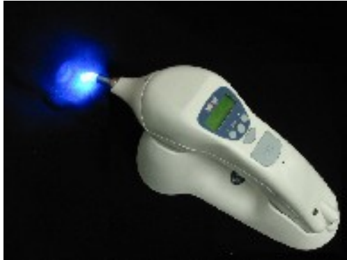
Polymérisation de composites dentaires