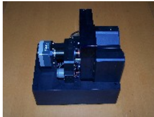
Lecteur de lames sérologiques