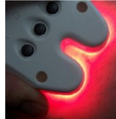
Trans-illumination en phlébologie